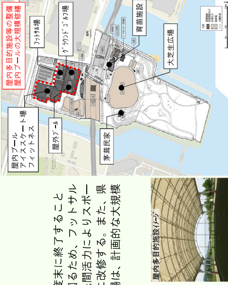
屋内多目的施設等の整備 屋内プールの大規模修繕