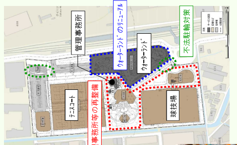
管理事務所等の再整備