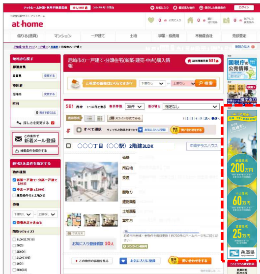
不動産情報サイト アットホーム

掲載場所：近畿エリア物件検索結果画面 対象種目：賃貸物件、売買物件 運営会社：アットホーム株式会社