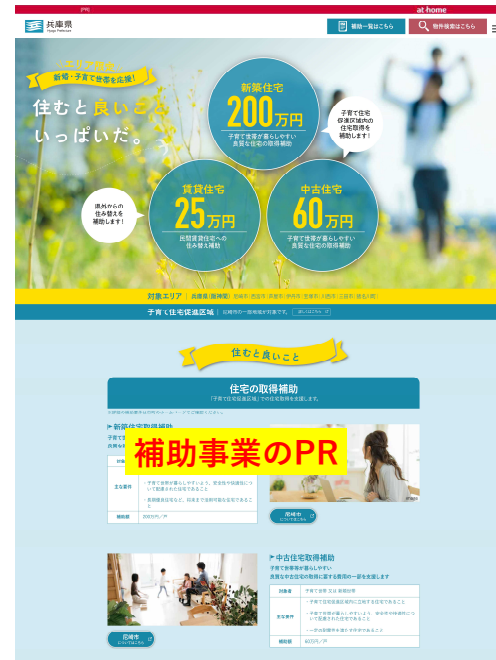
「不動産情報サイト アットホーム」内に作成した兵庫県の事業HP

掲載場所：近畿エリア物件検索結果画面 対象種目：賃貸物件、売買物件 運営会社：アットホーム株式会社