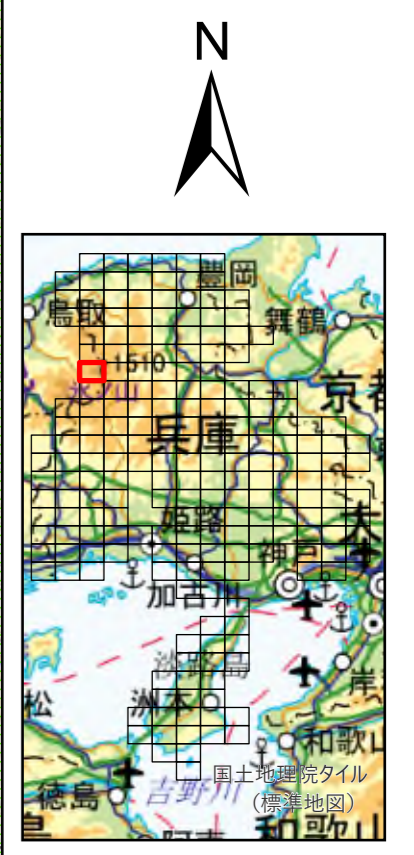
兵庫県 既存盛土等分布図 図郭番号：45