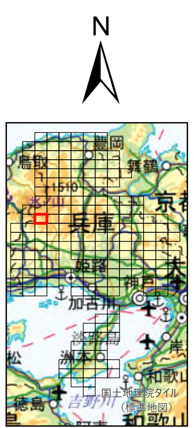
兵庫県 既存盛土等分布図 図郭番号：71