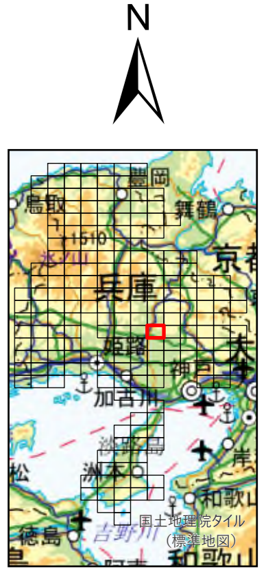
兵庫県 既存盛土等分布図 図郭番号：129