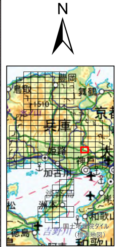
兵庫県 既存盛土等分布図 図郭番号：143