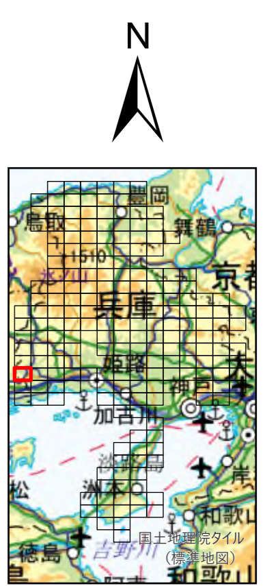
兵庫県 既存盛土等分布図 図郭番号：147