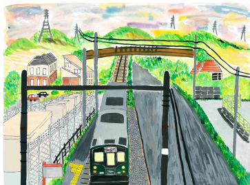
「今日も一日おつかれさま」