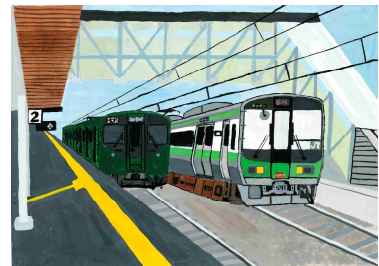
「すれ違う加古川線」