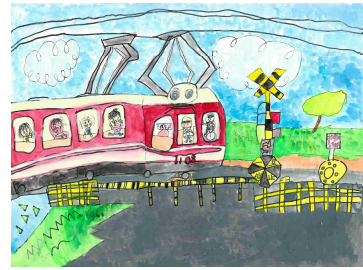
「みんなででん車にのったよ」