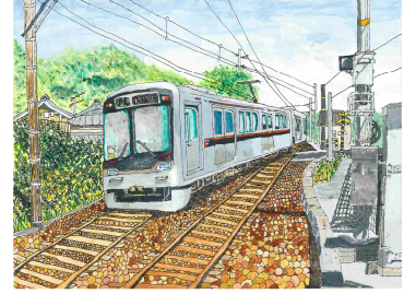
「線路は続くよ ぼくのまちへ」