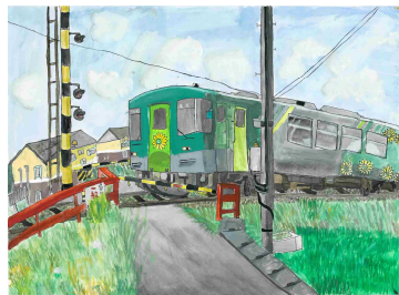
「橋のむこうをはしる列車」