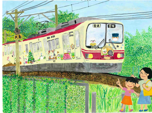
「私のお気に入りのラッピング列車！」