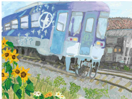
「夏の法華口駅を走る北条鉄道」