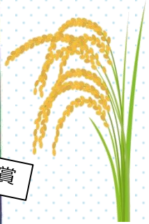
農村景観を守り続けるコミュニティづくり いきいき箸荷（多可町）