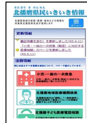
「北播磨県民いきいき情報」