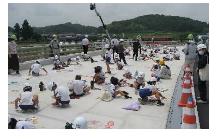
小野藍本線 松沢バイパス 小学生の橋梁お絵描き体験(小野市～加東市)