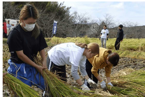
山田錦稻刈り体験