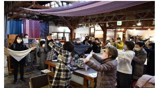
播州織体験ツアー（播州織工房館）