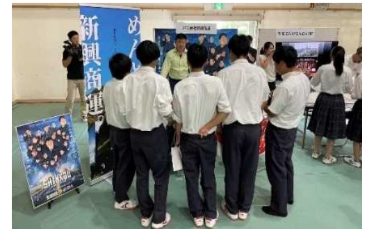
高校生への地元企業製品展示・説明会