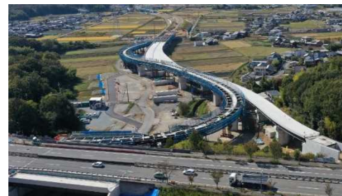
工事が進む 東播磨道(北工区)（三木市～小野市）