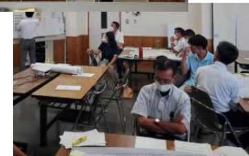
地域計画策定に向けた研修で集落内での話し合いを体験する市町・JA等の担当者