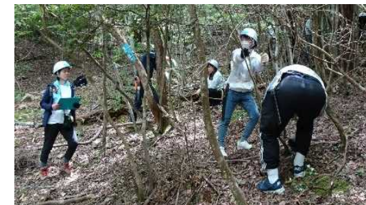
「自然共生サイト」として環境省から認定された「天然水の森 ひょうご西脇門柳山」にて里山整備体験を行うサントリー社員