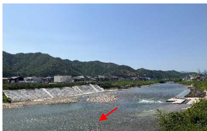
固定取水堰を改築して流下能力が大幅に増大した 杉原川(西脇市)