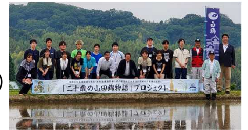
「二十歳の山田錦物語」プロジェクトの田植え体験