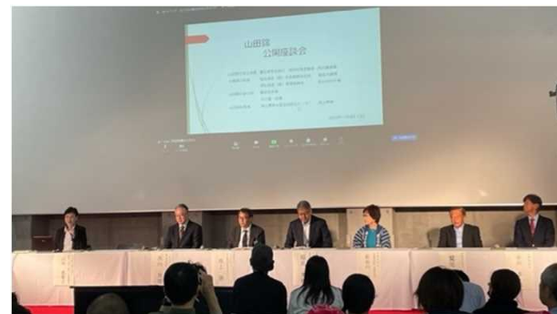
山田錦の語り部が参加した「山田錦座談会」 (北播磨「農」と「食」の祭典)