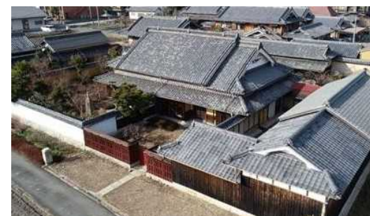
活用が予定されている西脇市嶋地区の空家