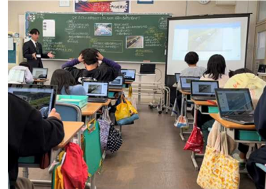
疏水授業(福田小学校)