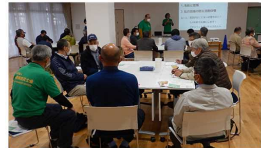
ワークショップの開催