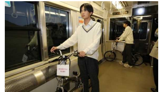
サイクルトレイン実証実験