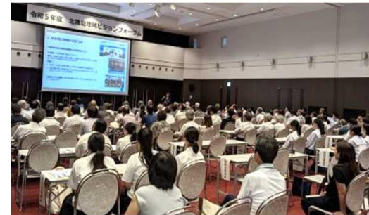
ビジョンフォーラムの開催風景