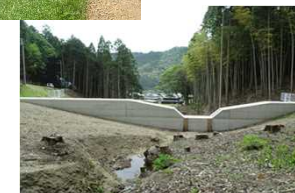
(上)改修されたため池 (下)集落を守る治山ダム