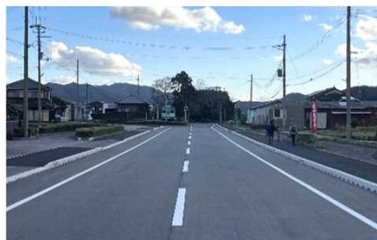
県道多可柏原線 歩道をリニューアルして歩行者・自転車の安全を確保(多可町)