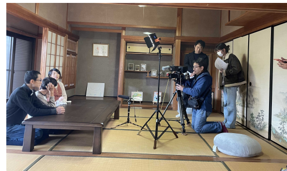
先輩移住者動画の撮影風景