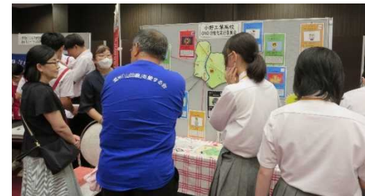
ビジョンフォーラムでの活動発表