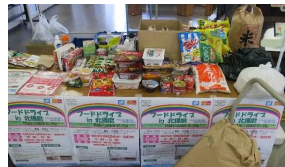
フードドライブin北播磨