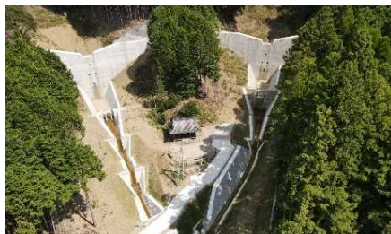
土石流から人命を守る 赤松川砂防堰堤（加西市）