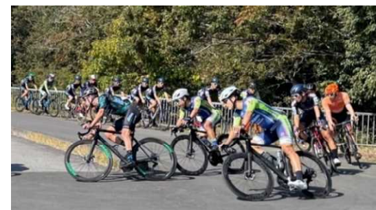
同コースで開催された自転車レースの様子