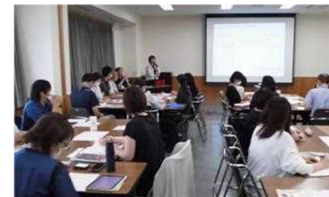
北播磨圏域地域包括ケアシステム推進協議会の様子