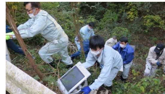
不法投棄物回収の様子