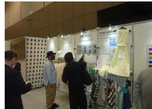
播州織総合素材展(東京国際フォーラム)