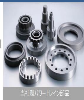
当社製パワートレイン部品