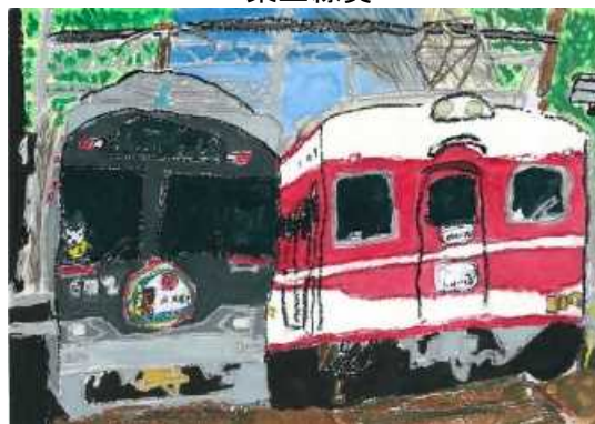
「すれちがうでんしゃ」