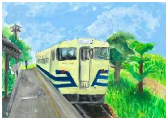
「キハが駅にある所」