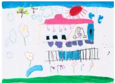
「北条鉄道に乗って、ピクニックに行きたいな！」 やししろ だい ゆうたろう 八代 醍 悠太郎 (善防こども園 年長)