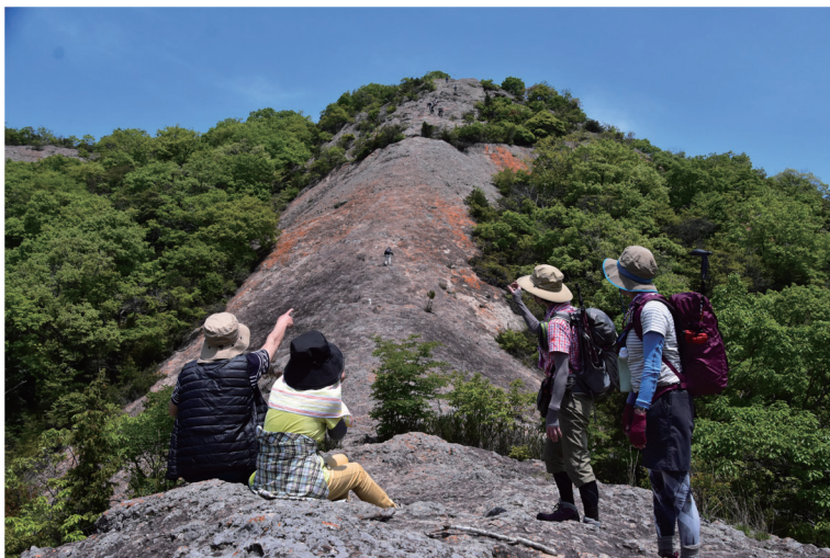
撮影場所：小野市 小野アルプス