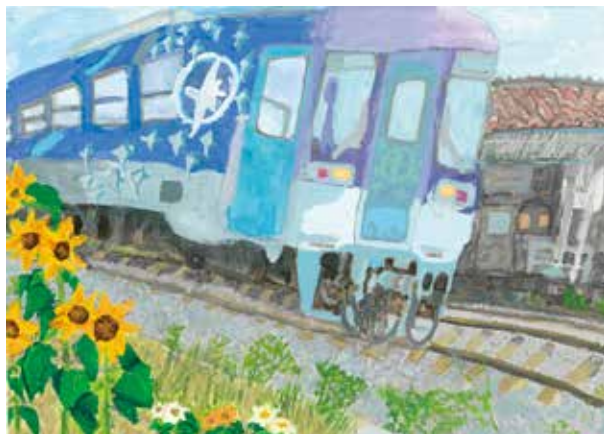
「夏の法華口駅を走る北条鉄道」