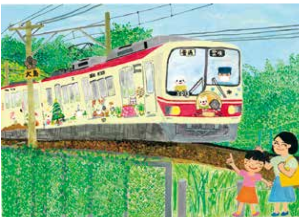
「私のお気に入りのラッピング列車!」