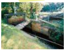
小野市船木取水地点