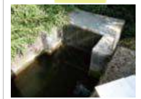
滝野浄水場への取水地点