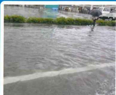
大雨で道路が水浸しになっている様子 (神戸市内)