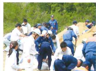
水防技術講習会土のう作成