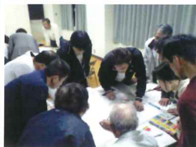
地域防災マップ作成ワークショップ