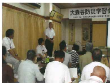
防災に関する講演会