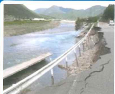
平成23年台風12号による被害 (加古川水系杉原川;多可町)