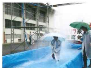
太子町ゲリラ豪雨体験