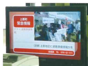
土砂災害情報伝達演習