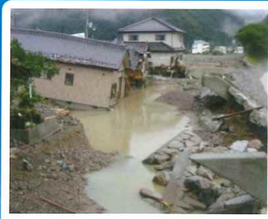
平成21年台風9号による被害 (千種川水系佐用川;佐用町)