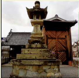
4 新明神社・酒見講