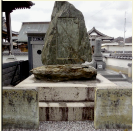
4 新明神社・酒見講