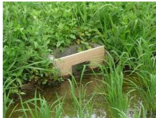
【田んぼダム：田んぼダム用セキ板の設置】