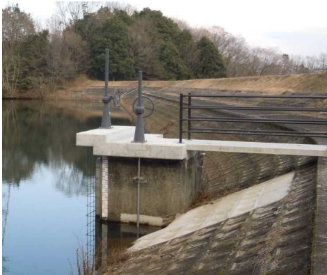
【ため池：オリフィスの改良工事】