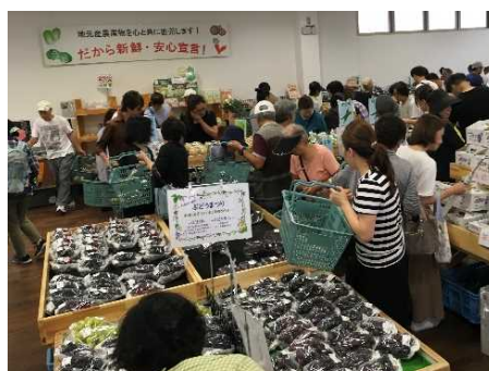
高品質ぶどう直売所リレーイベント