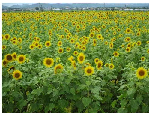
ひまわりが広がる風景（小野市）

このような状況の中で、TPP11（環太平洋パートナーシップに関する包括的及び先進的な協定）など国際的な経済連携協定の発効により、国内外の産地間競争が激しくなることが予測され、農林業を取り巻く環境が厳しくなることから、これまで以上に生産者・関係団体・行政等が一体となり、地域の農林業の振興と活性化に向けた課題に取り組むことが必要です。加えて、新型コロナウイルス感染症の5類移行後も県民の安全・安心な県産品を求める消費行動の対応や農業生産、流通、農村生活等への影響も考慮して取組を進める必要があります。