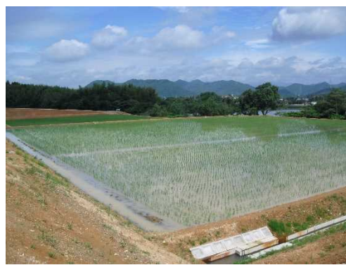
ほ場整備された農地（加東市）