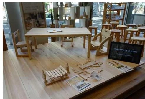
北播磨産ヒノキ材を活用した開発製品

森林資源の循環利用では、成熟しつつある人工林資源の有効利用を図るため、林業経営に適した人工林において、森林の集約化を図り、森林整備や原木生産を効率的かつ計画的に推進します。併せて、主伐・再生林の取組を進めます。一方、条件不利地にある人工林は、森林環境譲与税等を活用して手入れ不足の森林の間伐を進めます。