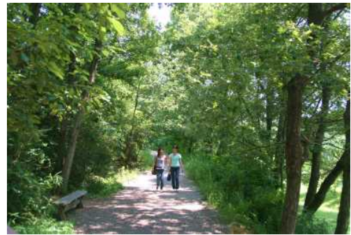
市街地周辺の里山林の状況（三木市）

また、市町が整備する交流施設や道の駅等において県産木材や地域木材を利用した公共木造施設が多く建築されています。今後も、低層の建築物をはじめ、学校や図書館、庁舎等においても積極的に木材利用が進むよう木造・木質化に向けての環境整備を進めるとともに、特に北播磨の人工林の70%を占めるヒノキ材の利用拡大を図る必要があります。