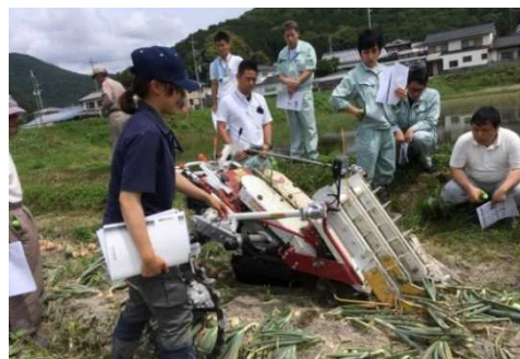
たまねぎ収穫機実演会