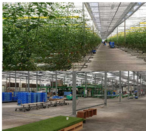
グローバルGAPを取得した兵庫ネクストファーム（加西市）