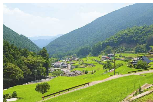
岩座神の棚田（多可町）

北播磨地域は、都市と近接した田園地帯であり、全国でも数少ない石垣のある棚田など地域資源にも恵まれており、田園回帰、定住を志向する都市住民等の関心の高い地域のひとつです。これらの都市住民等を対象に、北播磨地域の魅力を発信し、一層の都市との交流を促進することにより定住人口を拡大することが必要です。