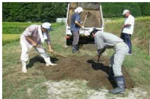
道路の補修（多可町）

農地や水路等の地域資源を農家だけでなく非農家等を含めた集落に住むすべての住民が担う共同活動の取組を進めることにより、農業基盤を維持・保全するとともに、集落の活性化や農業・農村の持つ多面的機能の維持・発揮を図ります。