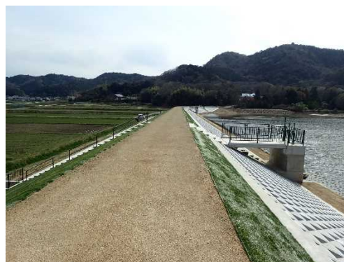
改修されたため池（加西市）

下流に住宅等があり決壊すると被害を及ぼすおそれのあるため池について、管理者講習会を開催するなど日常の管理体制を充実させ、定期的実施するため池の点検結果を踏まえ、決壊リスクの低減を図るための簡易な補修や低水位管理などを促します。特に決壊リスクが高いと判断されたため池については、関係者と調整を図り計画的に改修等を進めます。