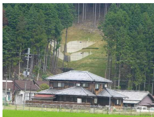
集落を守る治山ダム（多可町）

これらの他に、ため池や水田の持つ雨水貯留機能を活用した総合治水の流域対策に取り組むなど「ため池保全県民運動」を進めます。また、地すべり防止対策を進め、災害に強い農村づくりを推進します。