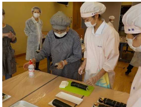
高校生を対象とした農産加工講座 (三木市)

併せて、食品表示に関して広く県民から情報提供を受ける体制のもと、情報に対して迅速かつ的確に対応するとともに、食の安全安心に係る問題発生時に迅速に対応するため、食品トレーサビリティの推進を図り、生産から加工、流通過程における信頼を確保していきます。