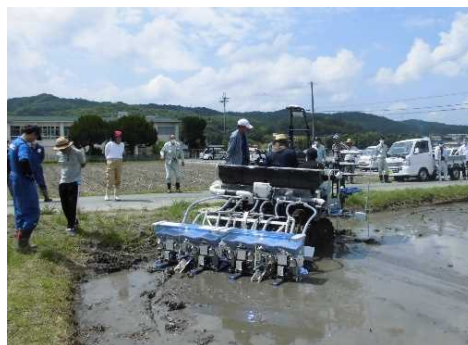
直進アシスト湛水直播機実演会

土地利用型農業では、集落営農組織や大規模経営体を主体に、直進アシスト田植機、自動運転トラクターやコンバイン、ドローン、自動水管理システム、水田センサー、ほ場管理システム等の導入が進みつつあり、農林水産技術総合センターとの連携で、作業の効率化による担い手不足の解消、山田錦等の地域特産物の高品質化・収量向上を図ります。特に、加西市、三木市、加東市では、国や民間メーカーが開発した技術の実証等を通じて、本県の多様な営農条件に適合した兵庫型スマート農畜産業技術を実践、確立します。