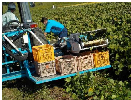
ひかり姫の収穫機実演

農業では、北播磨の特産農畜産物の魅力を向上させることにより、ブランド力の強化を図るとともに、6次産業化による付加価値向上や地域で消費を支える地産地消を促進します。森林・林業では、北播磨産木材の利用推進のため、幅広い需要に対応できる低コストかつ安定的な供給体制の構築を進めます。