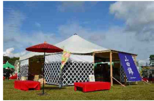
北播磨「農」と「食」の祭典（三木市）

道の駅や農産物直売所などの都市農村交流施設等を拠点として、来訪者のニーズに応じた農業体験、田舎体験、観光農園へのコーディネートやファーマーズマーケットの開催など、収穫から食べるまでの北播磨の魅力向上を図ります。