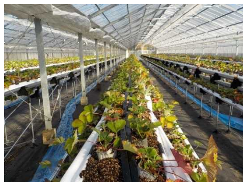
農業施設貸与事業を活用した 新規就農者のハウス（加東市）

花きは花壇苗生産農家によるオリジナル品種の育成や維持保存、新たな商品開発・販路開拓による有利販売で産地を活性化し、ブランドの構築を図るとともに、先進的な省力化・省エネルギー技術の導入を普及しま