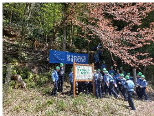
企業の森づくり活動（多可町）

また、ボランティア団体、NPO法人、企業など多様な主体による森林の保全活動を推進するとともに、緑の募金活動などの森林を支える仕組みを促進します。