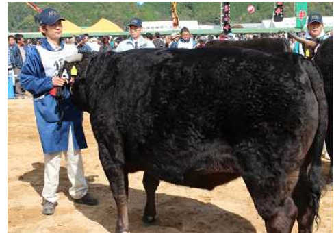
地域の有力ブランド 黒田庄和牛 (西脇市)

播州百日どりは関係機関が一体となって、生産面、流通面の支援により、地域ブランドとしての産地強化を行っています。今後、さらなる販売体制の強化に加え、担い手確保、法人経営体の育成も必要となっています。