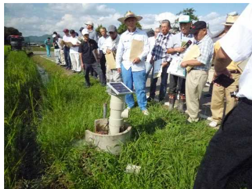
自動給排水実演会（加西市）

近年では、温度、光、CO 2 等を制御するICTを活用した次世代施設園芸団地で収益性の高いトマト生産が開始され、その成果の波及から、トマト、いちご、花壇苗等で導入をする生産者も現れ、ICTを駆使したスマート農業への取組が始まっています。