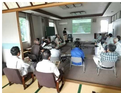
獣害対策集落研修会（小野市）

野生動物の農業等の被害では、南部を中心として全地域にイノシシの被害が見られ、その他シカやアライグマの被害が見られます。このため、野生動物毎の管理計画に基づく捕獲等による個体数管理を進めるとともに、被害発生地域等における獣害防護柵の設置等の対策による被害管理により、農林業等への被害軽減を図ることが重要な課題となっています。