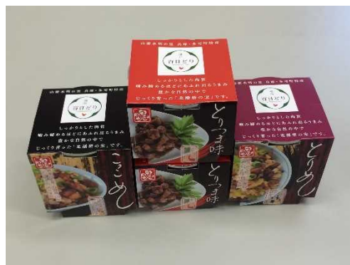
播州百日どりめしの具の缶詰

こうした地域の農産加工品を地元消費者だけではなく、広く都市部の消費者へ届ける取組を進めます。量販店、通信販売店、アンテナショップ等の多様な販売チャネルを活用した販路拡大を支援することで、新たな需要を開拓し、消費者ニーズに基づいた北播磨の農畜産物の生産を推進します。