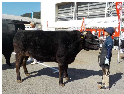
黒田庄和牛共進会（西脇市）

肉用牛肥育では、需要の高い神戸ビーフの安定供給のため、牛舎の暑熱対策等の飼養環境改善や、導入子牛の栄養状態の把握と肥育牛の栄養管理を徹底し、肉質、増体共に優れた肥育牛生産を進め、神戸ビーフ率の向上を図るとともに、地域ブランドである「黒田庄和牛」のPRに努め、ブランド力の強化を図ります。