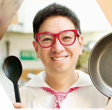
いのうえ クック井上。氏 料理藝人 クック井上。