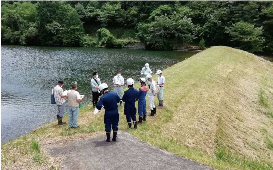
「豊かなむらを災害から守る月間」パトロール（養父市 峠下池）

6月は「豊かなむらを災害から守る月間」です。 梅雨や台風の時期を前に災害に備えましょう。