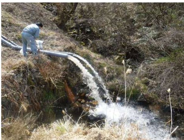
貯水位の落水状況 (丹波篠山市 奥新池)