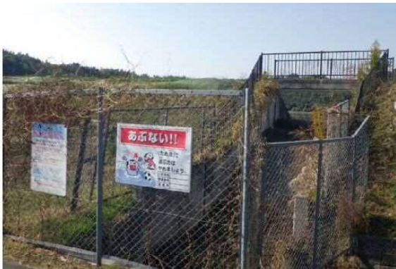
安全施設設置状況 (神戸市 上津橋大池)