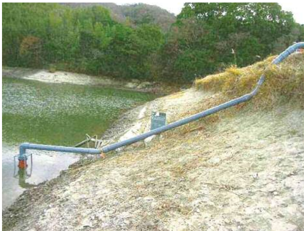
放流施設設備状況 (淡路市 皿池)