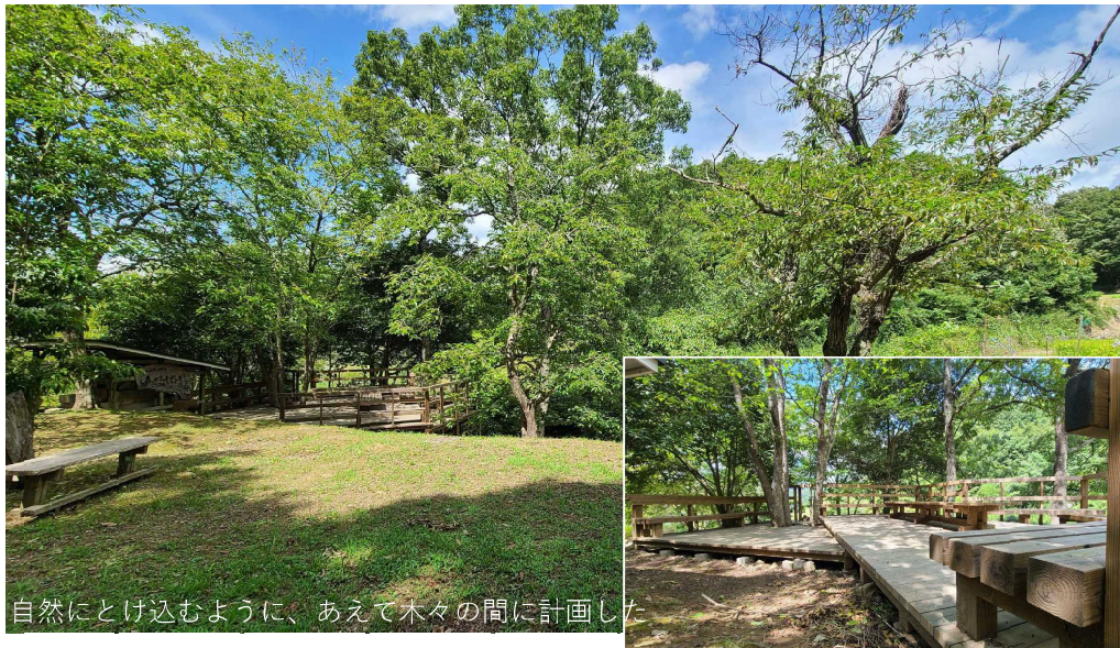
自然にとけ込むように、あえて木々の間に計画した