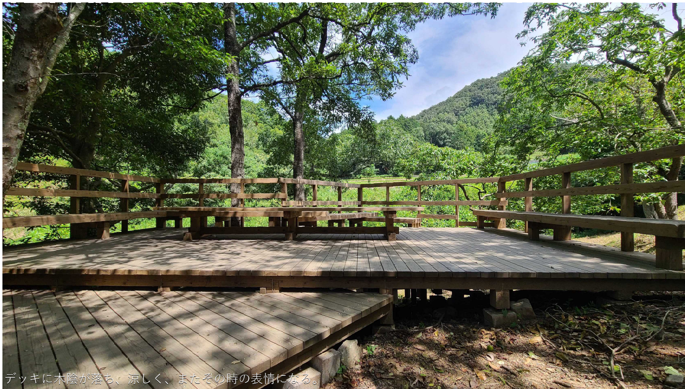
デッキに木陰が落ち、涼しく、またその時の表情になる。