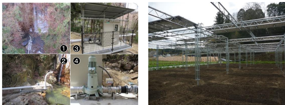
小水力発電所（神戸市灘区六甲川）