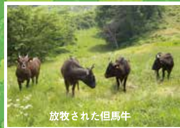
放牧された但馬牛