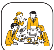
コミュニケーション