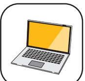
パソコンスキルアップ