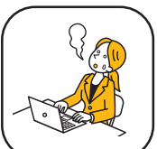
ストレスマネジメント