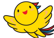
兵庫県マスコットはぼたん

兵庫県内で正社員として働きたい方を対象に 兵庫県内で正社員採用をしている企業とのマッチングを促進するプログラムです。 経験者を求める求人から未経験で応募できる求人等、様々な業種・職種の求人と出会えるチャンスです。 新たな仕事にチャレンジしたい方の参加をお待ちしております。