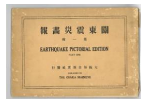
関東震災書報 1923 年大阪毎日新聞社発行