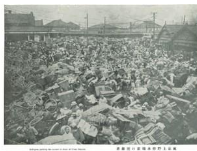
上野公園指して雲集する避難者