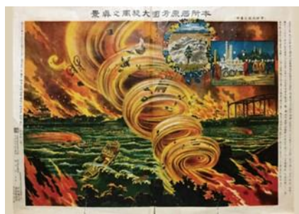
本所石原方面大旋風乃真景

画像コレクションの展示及びこれらの画像を編集した動画上映を行うことにより、関東大震災がどのような災害であったか、その特徴を伝えます。