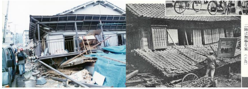
1階が潰れた木造家屋