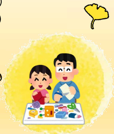
防災ポシェット をつくろう！