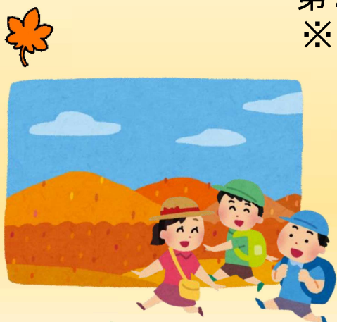
山登りで アドベンチャー♪

【申込締切】： 第1回 令和5年10月20日(金) 第2回 令和5年11月 3日(金) ※申し込み多数の場合は抽選