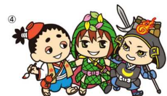
イメージキャラクター 山城 3 兄弟