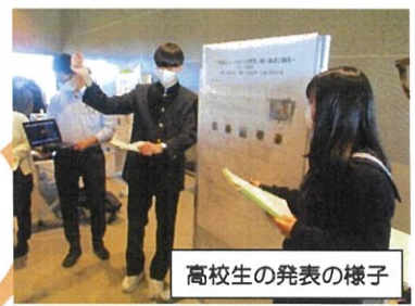
高校生の発表の様子

小中や小高の連携、保幼小や中高の連携については、これまでも取組が見られましたが、義務教育段階の児童生徒から高等学校、専門学校に通う学生、企業に勤める社会人まで一堂に会して行われるイベントは珍しいものです。児童生徒には、自分の持ち味に気づく機会となり、教員には、「総合的な学習の時間」や「総合的な探究の時間」の授業づくりのヒントになったように思います。特に小・中学生の総合的な学習の時間に探究した内容の発表に、高校生や専門学校の学生が熱心に耳を傾け、質問をしている姿はとても新鮮で、発表内容も、日頃の身近な疑問を題材にしたものからSDGsや高齢化問題まで多岐にわたっており、聞きごたえがありました。