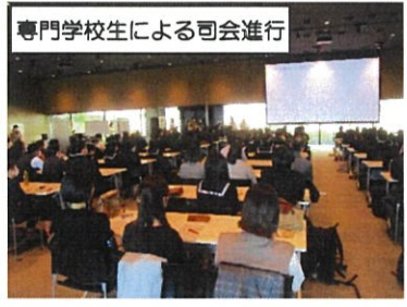
専門学校生による司会進行

三月五日(日)にアクリエひめじ大会議室にて、公益社団法人兵庫県専修学校各種学校連合会主催による、「高専連携プログラム キャリア形成イベント KOKOKARA」自分の持ち味の活かし方を考える一日」というキャリア教育に関するイベントが開催されました。