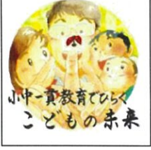
小中一貫教育でつなぐ 子どもの未来

姫路市教育委員会 学校指導課 小中一貫教育・ICT教育推進係 (079)221-2120