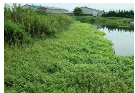
夏季に繁茂したナガエツルノゲイトウ

南アメリカ原産の水生植物。再生力・繁殖力が極めて強く、繁茂すると洪水被害、農業被害、生態系被害をもたらすことが懸念されている。