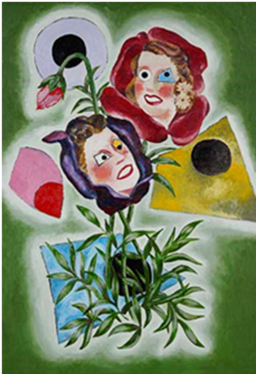
《妖花》2017年 作家蔵（横尾忠則現代美術館寄託）