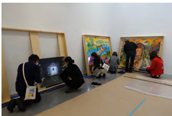
「GENKYO展」のための作品搬出作業 2020年12月24日～27日 横尾忠則現代美術館にて

一見「GENKYO 展」に喧嘩を売っているような企画ですが、展覧会担当者の皆さんは笑って受け入れてくれました。「GENKYO 展」と当館の「裏 GENKYO 展」、あわせて横尾ワールドを楽しんでいただければ幸いです。