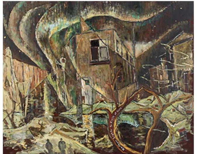
《黄金の荒野に北極光》2012年 作家蔵（横尾忠則現代美術館寄託）