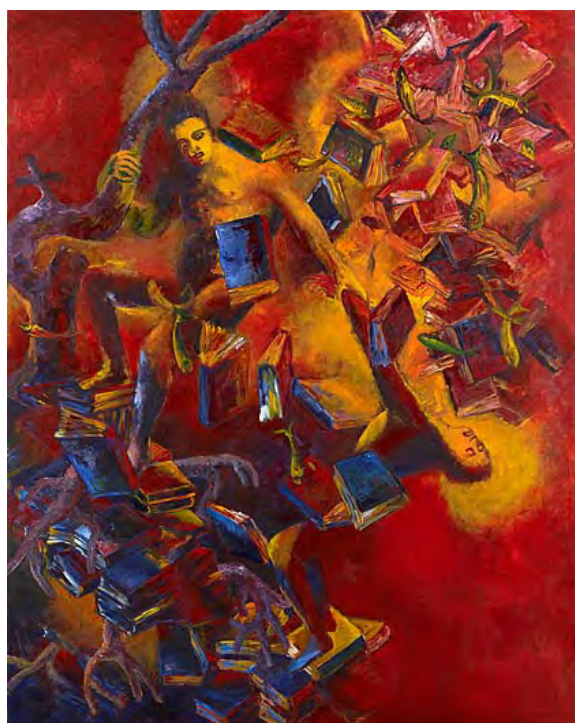
《方舟に持ち込む一冊の本》1996年 アクリル・布 作家蔵(横尾忠則現代美術館寄託)