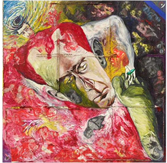
《マン・レイの夢》c.1987 作家蔵（横尾忠則現代美術館寄託）