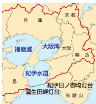
兵庫県周辺海域図