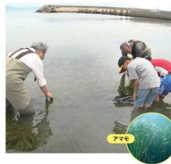
NPOと県民による藻場保全活動 (明石市) アマモの種子を採取している様子 種子は藻場の再生・創出に活用