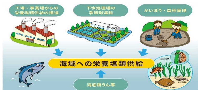
栄養塩類供給のイメージ