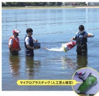
高校生によるマイクロプラスチック 調査・研究 (西宮市) 専用の機械で海水中のマイクロプラスチックを採取