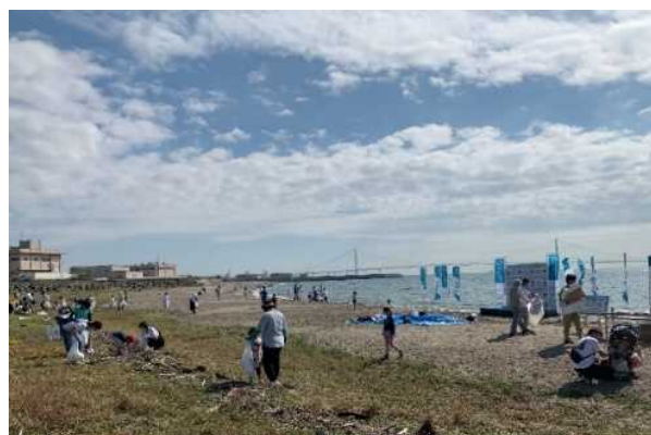
地域団体、事業者、行政が連携した海岸清掃活動（明石市） アプリによる活動状況の登録を推進することで、清掃活動の見える化を図る