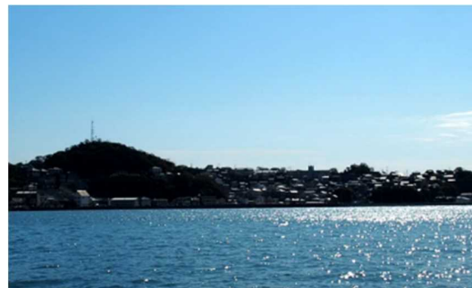
坊勢島 漁業見学&体験ツアー 資源増殖のための栽培漁業や海底耕うんの取組について、島の漁師から直接学ぶことができる