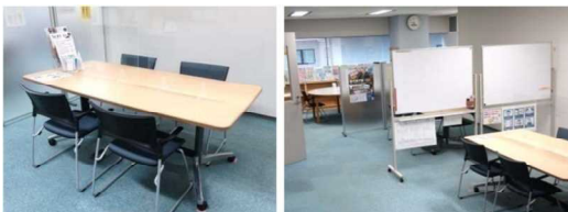
ミーティングコーナー

ひょうごボランティアプラザは、県民ボランティア活動の全県拠点として、ボランティアグループ、NPO等の交流ネットワークの場づくり、活動資金の支援、情報提供や相談等を行っています。また、災害ボランティア活動を支援しています。