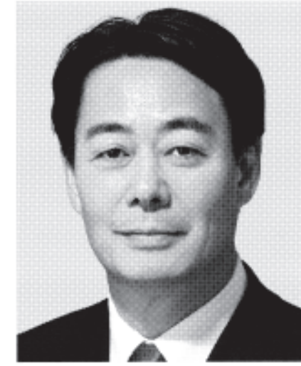
民主党代表 海江田万里