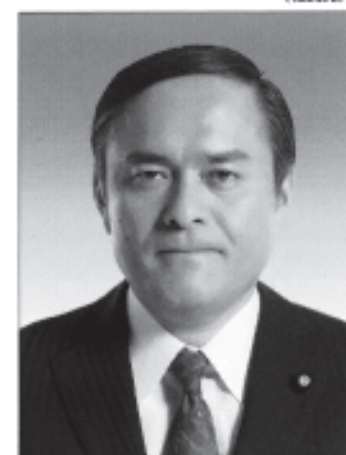
社民党党首 吉田 忠智