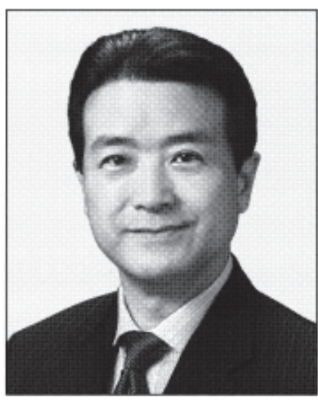
代表 江田 憲司