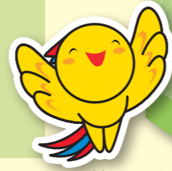
兵庫県マスコット はばタン