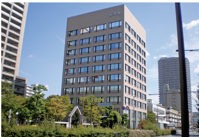
西宮市の国道2号線沿いにある茶色いタイル張りの本社です

は、これまで培ってきた技術やノウハウを活かし、自らのフィールド、建設事業で少子高齢化、防災、環境問題など現代社会の抱える多様な問題の解決に取り組んでいます。これからも、もっと豊かな社会づくり、安心・安全な地域づくりの担い手として社会に貢献し続けることを目指していきます。