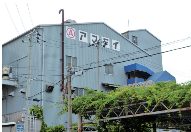
尼崎工場とアマテイ・ブランドのマークです

尼崎にある工場では安全第一を優先しながら「1本の釘・ネジで、ものどもの、人と人との繋ぎ、豊かな社会づくりに貢献します。」を企業理念とし、全社員が使命感と誇りを持ち、社会から信頼される製品を世に送り出すため、頑張っています。