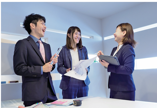
互いを尊重し、連携を大切にしています

ところで皆さんは、「働く」「社会人になる」ということにどのようなイメージをお持ちですか？仕事とは、元来、「誰かの役に立つ」ということ。私たちは、幅広い事業で人々の暮らしに笑顔を増やし、社会から必要とされる企業として挑戦し続けています。