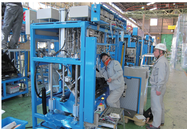
製品の完成間近です。最終チェックは期待と緊張の瞬間です！

スタートすることが多く、ゼロから新しいものをつくるということも珍しくありません。技術面での課題を様々な角度から検討し、社員一丸となって取り組みます。新しい案件では困難に直面することもあります。それを乗り越え、機械が稼働した時の達成感は何ものにも代えられません。