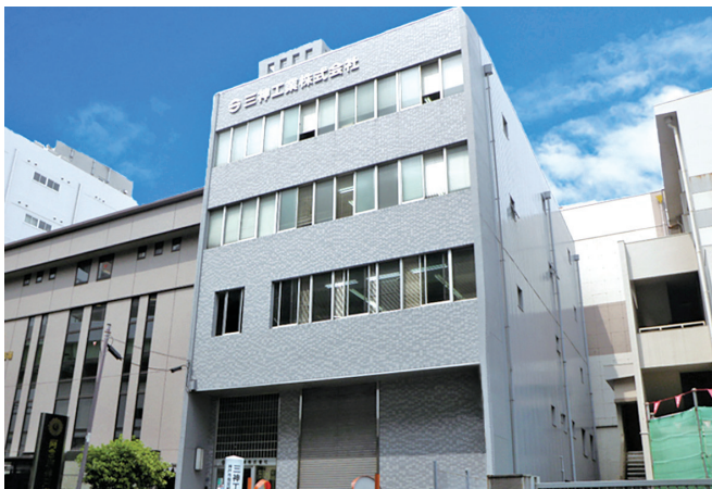
神戸三宮の中心街にある当社本社

今後もお客様をはじめ、地域社会の様々なニーズに合った最適な設備空間を提供し、地元の活性化に少しでも寄与できるよう、若い力を積極的に取り入れ、ますます精進してまいりたいと考えております。