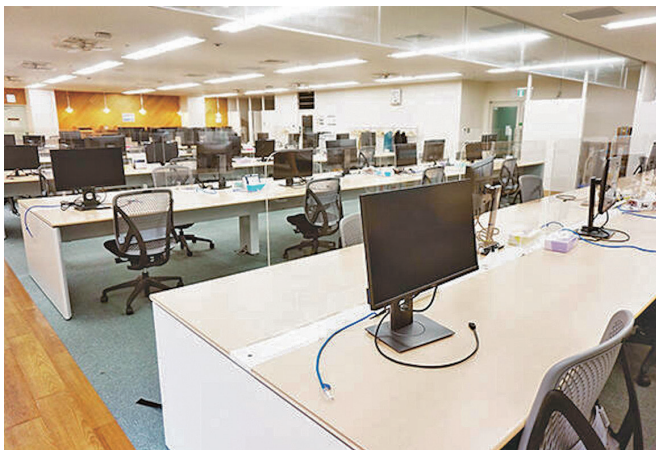
フリーアドレスで綺麗なオフィスです

設立から27年目を迎え、これまで蓄積した経験やノウハウをもとに、アイデアをお客様に提供し、デジタルテクノロジーを活用して社会をよりよくすることが我々のミッションです。