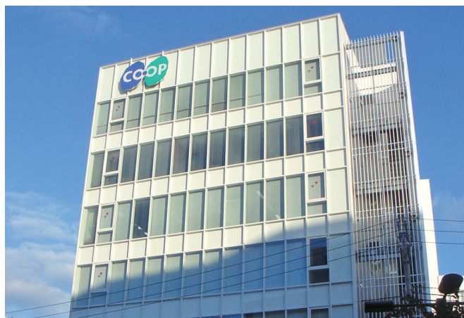
あじさつが多い明るい雰囲気のある事務所です

これからも地域の住民に必要とされる、そんな組織であるべく、様々な取り組みを行っています。