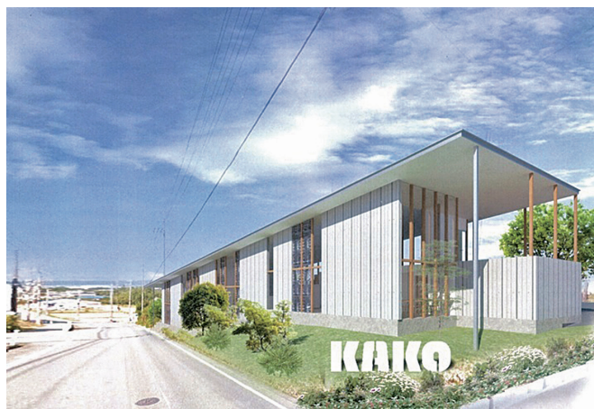
カコテラス（社員の憩いの場）のイメージ図

また、小野工場は1980年開業以来40年を経過し、老朽化対策として機械工場を2021年5月建設移設し、2022年1月には板金工場を移設、カコテラスを新たに建設中です。2022年度中には旧工場建屋も改修し、利便性アップと社員コミュニケーションの向上を図ります。