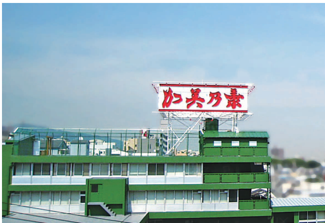
神戸市中央区にある本社工場

今後は、長年培った技術力を生かし、ヘアケア商品にとどまらず、女性用の商品やスキンケア商品など新たな分野にも積極的に挑戦し、100年ブランド企業を構築すべく、若手社員を中心に、全社一丸となって取り組んでまいります。