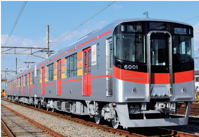
地域のお客さまとともに、これからも山陽電車は走り続けます！

地元である兵庫県で働き続けたい、地域に貢献できる仕事をしたいという方は、男女問わず大歓迎です！地域のお客さまの足として生活を支え続け、2017年に創立110周年を迎えた歴史ある山陽電車で、あなたも鉄道のプロフェッショナルを目指してみませんか？私たちと共に、山陽電車の新たな歴史を創っていきましょう！