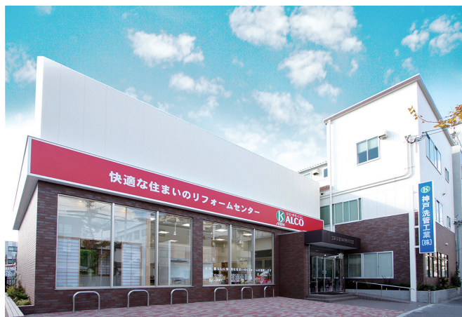
本社ならびにリフォームセンター

建物が古くなるのに伴い、給排水管の劣化による取替工事、室内でのトータルリフォーム等多角的な事業拡大により、弊社の業務内容も多角的に対応できる体制へと変化した結果、社名とは異なった総合的な会社体制へと脱皮している事業所です。