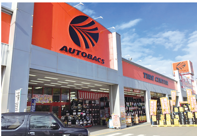
オートボックスは、豊富な品揃えが特徴！

そんな当社のフィールドで共に励み、成長できる仲間巡りに巡り合えることを楽しみにしていますのでぜひご応募ください。職場見学も歓迎いたします。