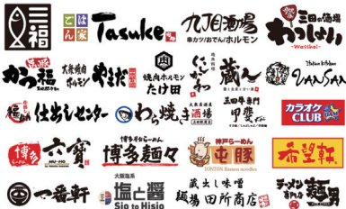
福助グループの店舗ロゴ