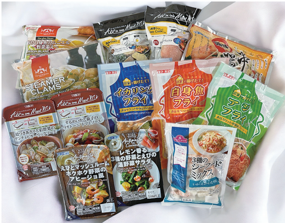
シーフードを主に扱う冷凍食品メーカーです

また、『皆様に必要とされる企業』を目指し、地域社会の一員としてスポーツチームの公式スポンサーなど、社会貢献活動にも積極的に取り組んでいます。これからも、簡単・便利でおいしい冷凍食品で皆様の食卓に笑顔をお届けいたします。