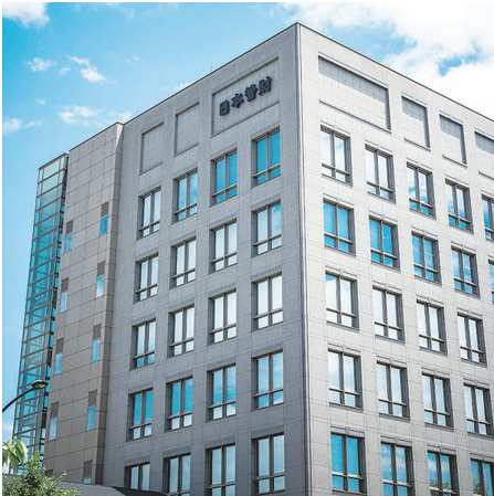
西宮市にある当社自社ビルの外観です

どを「人を介して」支えています。当社が管理する建物は商業施設ばかりではありません。官公庁や地方自治体が所有する建物や総合病院、ホテルなどの宿泊施設、大学などの教育機関など契約先の建物の種類はたくさんあります。生活している皆さんの「何気ない日常を支える」とてもやりがいのある仕事です。