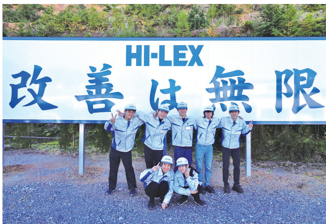
仕事を通じて社会に貢献する、立派な人を創る

今後の事業は、次世代の車にも使っていただけの電気・電子部品と一緒にした製品や、できるだけ人に負担をかけない痛みの少ない医療機器製品を世界に発信していくことに力を入れています。