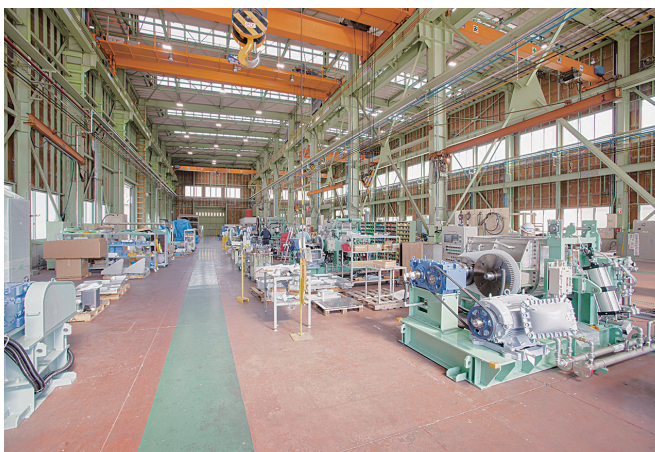
本社工場で機械を組み立てる様子

を展開しています。2020年5月には、新たにドイツの機械メーカーであるライフェルト社をグループ企業に加えたほか、2021年には新工場が完成し、さらなるグローバル化、事業拡大を進めています。