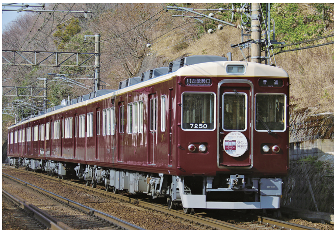
平野駅～一の鳥居駅間を走行する7200系車両

従業員の健康づくりに取り組み、経済産業省「健康経営優良法人認定制度」において、「健康経営優良法人2023（中小規模法人部門）」に認定されました。