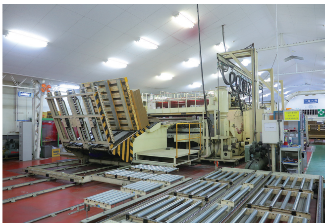
日本最大級の特種大型印刷機が活躍！

始。お客様の倉庫内や自社倉庫で出荷までの作業をしています。具体的には、商品に異常が無いかの検品、包装、梱包や出荷準備など一連の物流サービスです。『パック・ミスタニに任せたら、「ハコ」も「ハコブ」も安心。』そんなサービスを目指し、段ボール製造と物流事業でお客様の「運ぶ」を支えます。