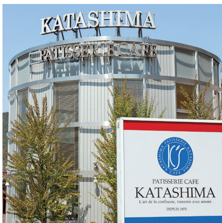
パティスリーカフェ カタシマ 養父本店

2015年ミラノ万博へ「メシテラ」出展（豊岡市産コウノトリ育むお米100%使用のカステラ）、2017年ロンドンSFFFへ「朝倉山椒のタブナード」ほか出展（養父市産の朝倉山椒）、2022年「天滝ゆずのマーマレード」ダルメイン世界マーマレード3年連続金賞受賞！