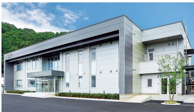
2022年7月 新本社 完成

また、社員が誇りを持って仕事に取り組むことができる環境づくり、お客様とシステムリサーチを大切にし、心のもった仕事ができる人材があふれている…そんな会社づくりを大切にしています。