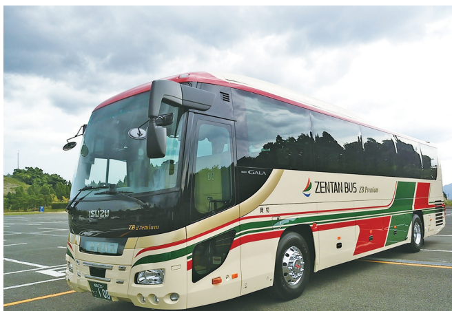
特別仕様の観光バス ZB Premium

を最優先に「安心」と「快適」を提供する企業グループとして、地域社会と共に歩み、地域の皆さまの生活に欠かせぬ存在として、これからもお客様目線に立った利便性の向上、サービスの提供に努めます。