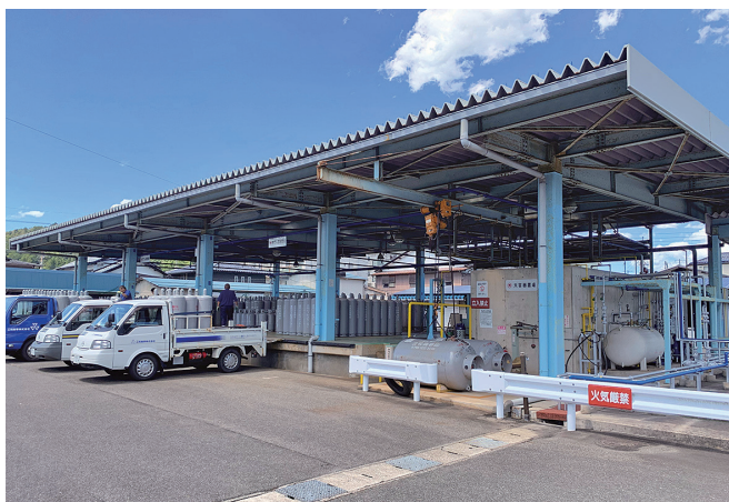
但馬エリアのエネルギー供給を支えています

の生活を支えています。当社の強みは何と言っても、70年以上かけて築き上げてきた地域での実績、お客さまとの信頼関係です。そして、私たちが目指すのは「地域No.1」企業。エリアの拡大ではなく、創業からお世話になっているこの地で、もっともっと深く根差していきます。