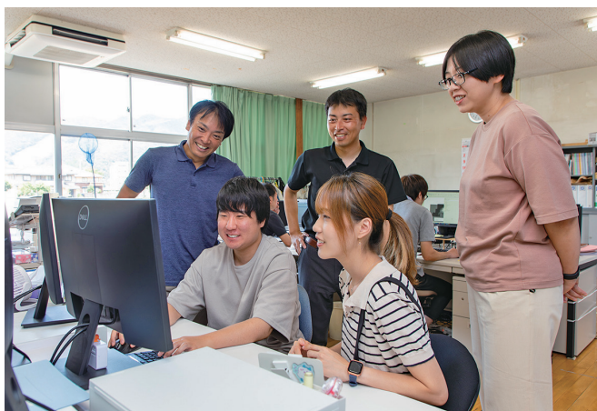
ミーティング風景

また、社内活動としてSDGsやWLBにも取り組み、若者雇用の支援として『奨学金支援制度』を導入し、若者の地域定着にも力を入れています。