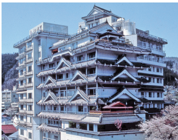
湯村温泉にそびえ立つお城造りの朝野家