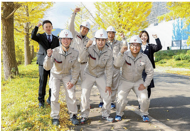
若手とベテランと一緒に活躍できる会社です

土木と建築の総合力で様々なプロジェクトを手掛けることで、地域の発展とそこで暮らす皆さまの安全と安心を守る地域防災の担い手として今後も活躍してまいります。