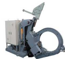
写真：電動大結束機

所在地：加古川市平岡町中野 211-1 設立：1948年 資本金：96百万円 従業員数：179名