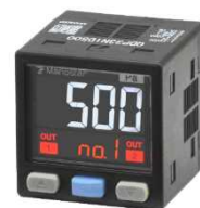
写真：マノスター微差圧計