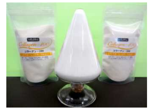
写真：コラーゲンペプチド