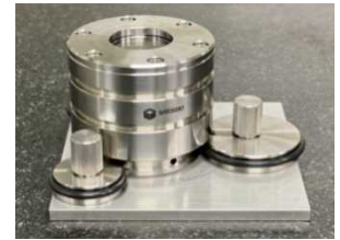
写真：大気遮断型試料輸送容器

所在地：姫路市余部区下余部 240-6 設立：1955年 資本金：18百万円 従業員数：46名