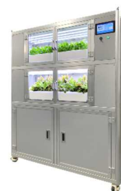
写真：船用水耕栽培装置