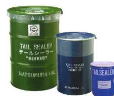
写真：テールシーラー