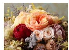
写真：プリザーブドフラワー