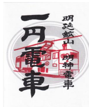
〔明神電車「一円電車」印章〕