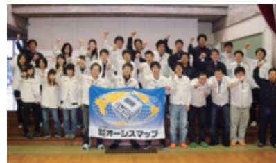
オーシスマップメンバー