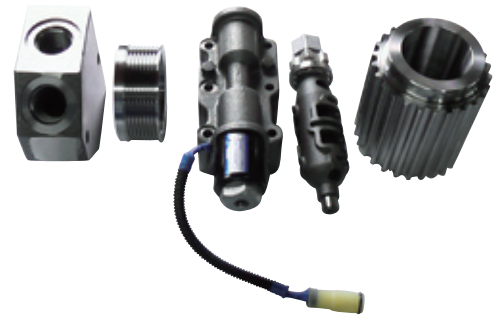
製品一例(油圧ブロック・チェンジドラム等)