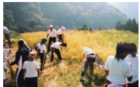
中学生の稲刈り体験