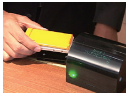
携帯電話で外湯の受付