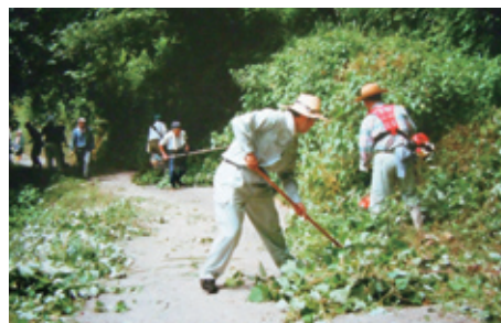
棚田交流人と地域住民との共同作業