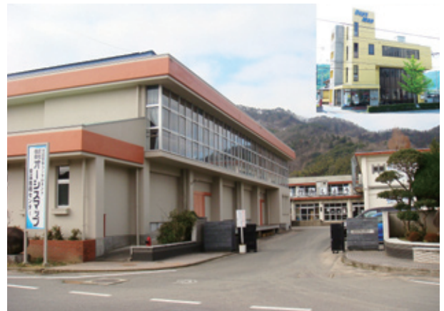
青溪技術センターと本社ビル

2006年「中小企業支援ネットひょうご」から、成長期待企業として認定を受けており、新しい可能性に挑む企業として注目されている。また、2010年3月に閉校となった旧青溪中学校の跡地に「オーシスマップ青溪技術センター」として進出し、空校舎の再活用を図っている。一方、「男女共同参画社会づくりに積極的に取り組む事業所」として県と協定を締結しているなど、新たなコミュニティーの核として地域の活性化にも大きく貢献している。