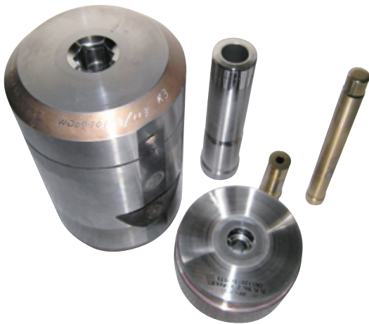
製品一例(金型ダイス・パンチ等)