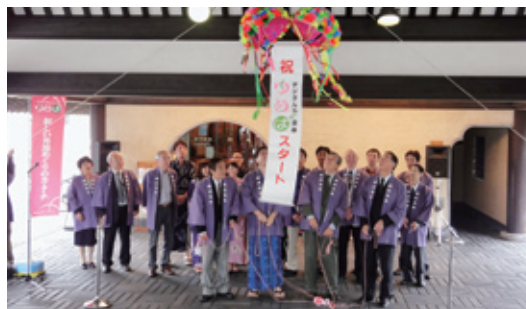
「ゆめば」のオープニングを祝って