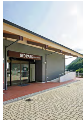
ガイドセンター外観

また、平成22年度の世界ジオパークネットワーク加盟認定時より、すべての社員に呼びかけジオパークに関する座学・現地研修会を実施し、知識向上、観光客への情報発信に努めるとともに、城崎マリンワールド園内では、ジオパークをテーマとした看板や広告展開を図るなど、但馬地域内で有数の観光施設において、会社・施設全体、ソフト・ハード両面から、一丸となった先導的・積極的なジオパーク活動を展開している。