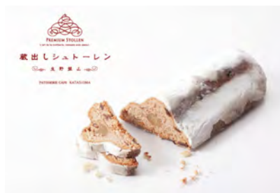
「生野銀山 蔵出しシュトーレン」