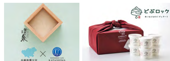
(鉢伏の泉) × (カタシマ)