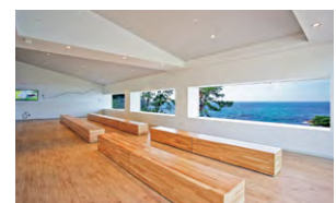
3つの窓で景色を切り取った館内