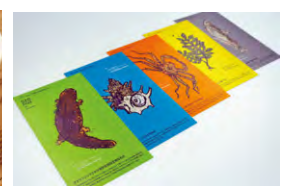
ジオパークが育んだ生きものたち紹介チラシ