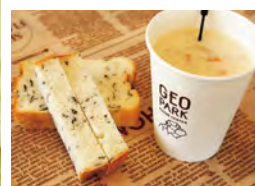
但馬の海の水かめが入ったわかめパン