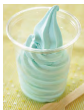
竹野の誕生の塩を使用した塩ソフト