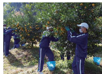
柚子の収穫 (地元中学生野外授業風景)