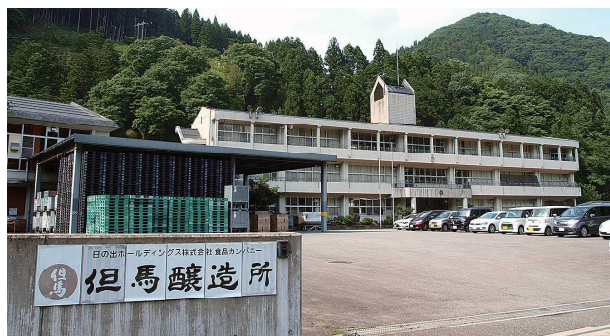
外観 (旧西谷小学校校舎)

危機を機会にスピード感をもって転換させ、既存商品の製造過程で発生する柚子の残渣を活用して、「柚子の香り」など消毒用エタノール製品に付加価値をつけたアイデアと行動力で経営革新に取り組んでおり、今後の成長性が一層期待される。