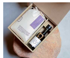
醤油じかん 手作り醤油キット