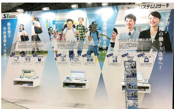
展示会展 (e3school シリーズ)