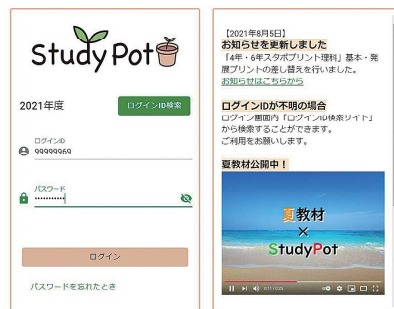
オンライン教材配信システム「StudyPot」