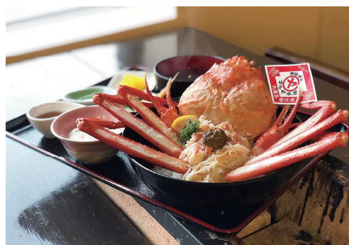
直営店 香住ガニを使用したメニュー（マルヤ丼）