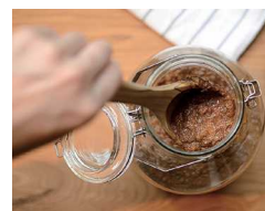
醤油キット 混ぜて育てる