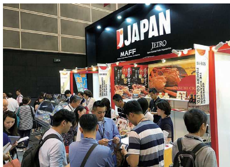
香港展示会出展の様子