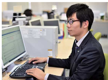
システムエンジニアによるシステム開発