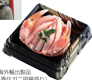
海外輸出製品 (香住ガニ甲羅盛り)