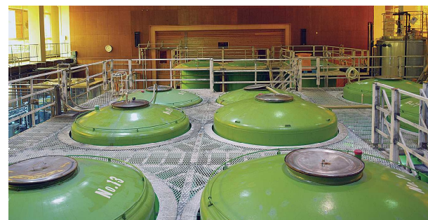
工場内 (旧西谷小学校体育館)