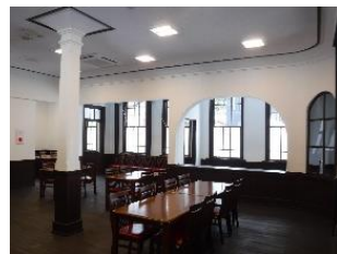
旧グンゼ棟（景観形成重要建造物）