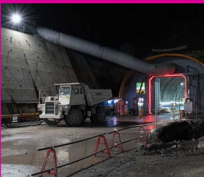
新諸寄第2トンネル(仮称)

安全第一で工事を進めますので、引き続きご理解・ご協力のほど、 よろしくお願いいたします。