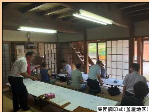
集団調印式(釜屋地区)

これで民地の境界線が確定したことになります。引き続き、残るトンネル区間の境界確認作業を進めていきます。 今後設計を進め、道路に必要な面積が確定した地区では、順次用地協力のお願いをさせていただきます。よろしくお願いします。