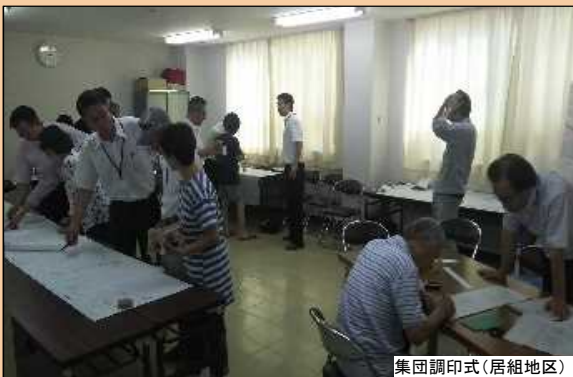
集団調印式(居組地区)

昨年度より立ち会いいただきました用地境界を確定するための集団調印式を各地区で実施しました。お忙しい中ご協力いただき、ありがとうございました。