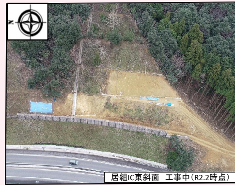
居組IC東斜面 工事中(R2.2時点)