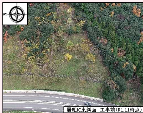
居組IC東斜面 工事前(R1.11時点)

東浜居組道路について、4月以降片側交互通行規制や路肩規制を実施します。ご理解・ご協力をよろしくお願い致します。