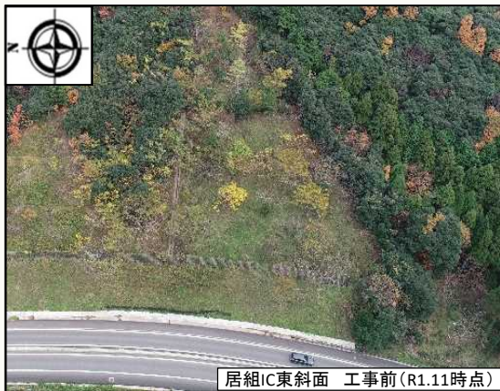
居組IC東斜面 工事前(R1.11時点)

今後は引き続きIC東側の山の掘削を行っていくとともに、南側の山の掘削にも着手してまいります。引き続き安全面に細心の注意を払い工事を進めてまいりますので、ご理解・ご協力のほどよろしくお願い致します。