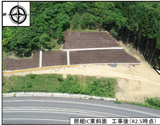
居組IC東斜面 工事後(R2.5時点)